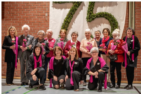
75 Jahre Kath. Frauenbund, Zweigverein Maria-Thann Jubiläumsveranstaltung am 14.03.2026 in der Turn- und Festhalle Maria-Thann