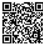
„Gesund und fit durch die Schwangerschaft“