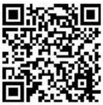
„Kinderleicht und lecker“

Möglich: Eltern-Kind-Gruppen oder Gruppen von z. B. „Geburtsvorbereitungskursen“ können unsere Themen auch als eigene Veranstaltung anfragen. Die Zeitressourcen unserer Referentinnen und Referenten sind bei der Terminvergabe entscheidend.